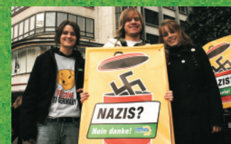
Eure GRÜNE JUGEND Niedersachsen

und erhebe deine Stimme gegen Nazis oder engagiere dich in der Antifa-AG in deiner Schule, deiner Uni oder deinem Betrieb. Aber Ausgrenzung fängt auch im Kleinen an. Setz dich gegen Intoleranz und Diskriminierung nicht nur bei Nazis, sondern auch bei deiner Verwandtschaft und in deinem Freundeskreis ein. Wir wollen jetzt frei und gemeinsam ohne Nazis leben. Also, auf geht's. Abrocken und Nazis stoppen!